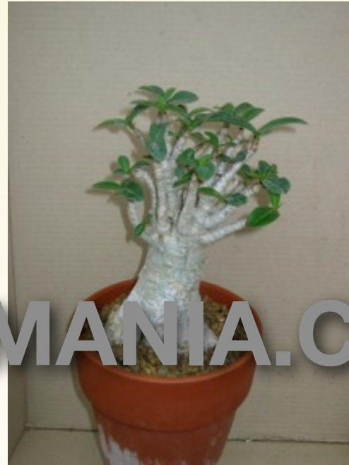
ADENIUM ARABICUM CV THAI SOCOTRANUM