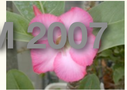
ADENIUM BOHEMIANUM (BAS)