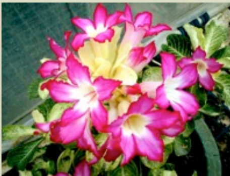
ADENIUM SOMALENSE CRISPUM