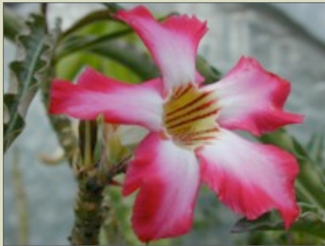
ADENIUM SOMALENSE (HAUT)